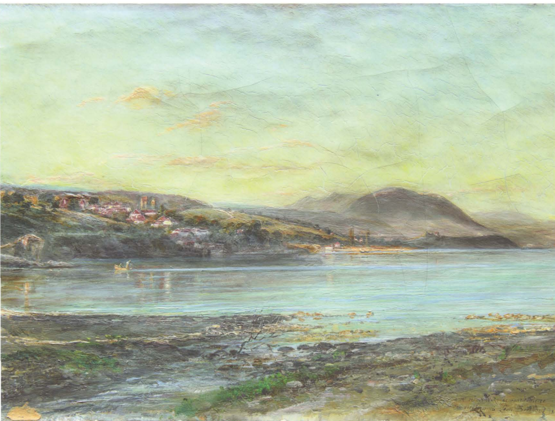
Léon Berthoud, «Saint-Aubin vu du lac», 1886, huile sur toile.

On a renoncé à étendre les recherches à tous les Rougemont descendant de cette souche; on s'arrête au début du XVI e siècle pour ceux de Provence, au début du XVII e siècle pour ceux de St-Aubin.